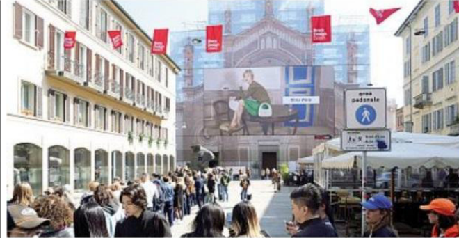
Curiosi Una delle interminabili code in Santa Maria del Carmine per l'installazione della ditta di cosmetica di lusso Aesop. A sinistra dall'alto: la bag di Missoni, la carta dei profumi Alfaparf, i fiori della Vespa e le «bolle» dei dentifrici Marvis

Gli aspiranti creativi In fila ci sono soprattutto persone che non hanno la minima idea di cosa stanno andando a vedere