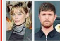
In città L'attrice e il cantante

Milano come Hollywood: in occasione della Design week sono arrivate le grandi star internazionali. Rh, marchio americano di luxury design , ha inaugurato il suo negozio nello storico Palazzo del Principe di Piombino, in corso Venezia, con una festa da tappeto rosso: hanno sfilato Margot Robbie, Zoe Saldana, Brunello Cucinelli, Roberto Bolle, Remo Ruffini e tanti altri. Tra gli eventi più esclusivi, il concerto del cantautore britannico James Blake, ospite di Stone Island: lo spazio del brand di moda si è trasformato in una listening room grazie