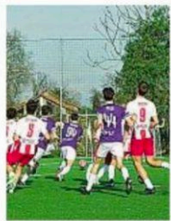
Trofeo il 28 maggio l'ultimo atto

Delle 36 squadre di questa quarta edizione, ne sono rimaste 16. Fuori dai giochi i licei classici (Beccaria, Carducci, Parini, Berchet, Manzoni, Omero-Russell). Si sono conquistati invece l'accesso vincendo i playoff Virgilio e Don Bosco, Cremona-Zappa e Einstein. Gli altri qualificati sono Vittorini, Cattaneo, Marie Curie e De Amicis, in testa a pari merito alla classifica provvisoria e poi Torricelli, Vittorio Veneto, Cardano, Et-