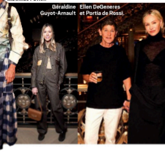
Ellen DeGeneres et Portia de Rossi.