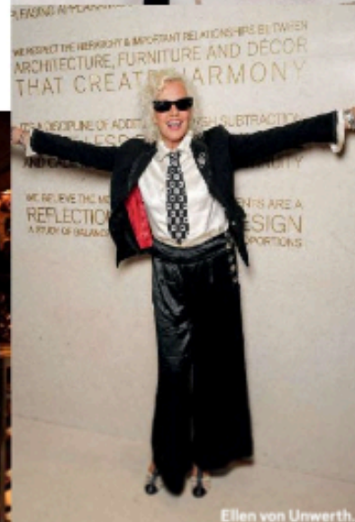
Ellen von Unwerth.