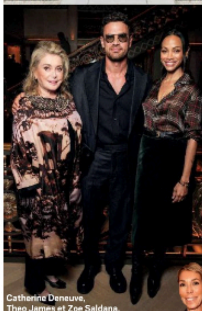
Catherine Deneuve, Theo James et Zoe Saldana.